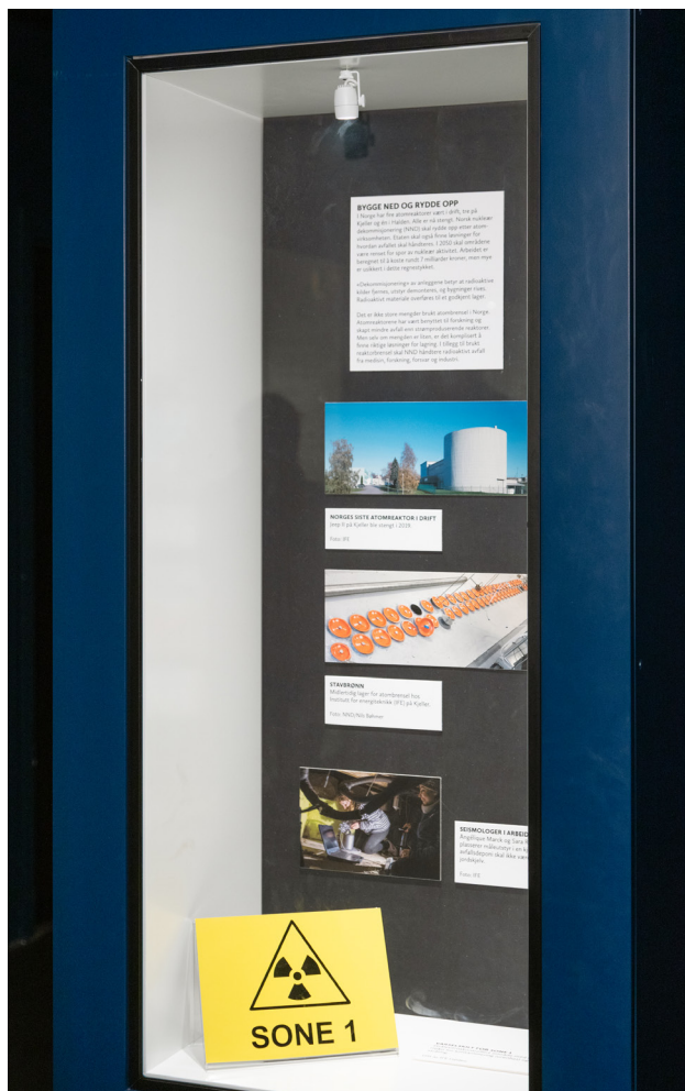
En søylemonter som presenterer norsk nukleær dekommisjonering (NND) og opprydning etter fire norske atomreaktorer.

som for ressurskrevende, men også noe som kunne komme til å stå i veien for det retoriker og medieviter Jens Elmelund Kjeldsen omtaler som latent retorikk i bilder, som ofte er flertydige. 18 Som betraktere blir vi medskapere av utsagnene og bidrar samtidig til å overbevise oss selv. 19 Men når utgangspunktet, som her, er en tradisjonell kulturhistorisk utstilling, med både tekst og bilder, vil det være nyttig å avklare hvilke tekstlige sammenhenger fotografiene har fungert innenfor.