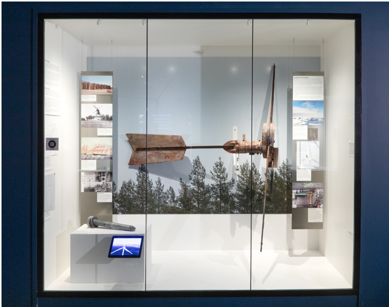
Perspektiver på norsk vindkrafts historie, som del av utstillingen Energi i klimakrisens tid.

Å gjengi alle tekstene er det heller ikke plass til, men å vise til hovedtemaene er viktig for å kunne gi et inntrykk av fotografienes plass i helheten og kunnskap om tematisk vektlegging. Når «Fosen-saken» blir forholdsvis grundig beskrevet her, er det fordi den var aktuell med avgjørende, politiske hendelser samtidig med at utstillingen ble laget og denne undersøkelsen ble planlagt. Temaet har fått plass i en liten «søylemonter», der innholdet kan forandres ved behov.