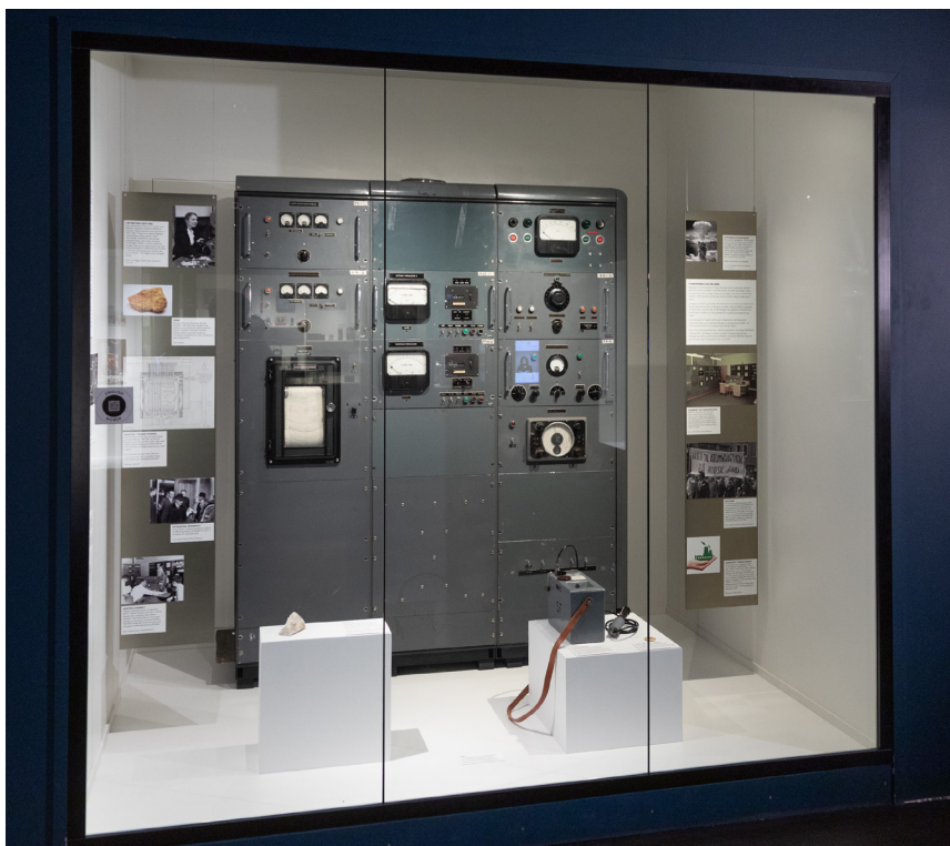
En monter som gir innblikk i norsk kjernekrafts historie. Del av utstillingen Energi i klimakrisens tid.

I denne forandingsprosessen ser jeg som kulturhistoriker verdien av å bruke kunnskap på tvers av faglig og personlig engasjement. Det gjelder både i møter med besøkende på museet og i diskuterende tekster som dette. Tilsvarende det blant andre historiker Synne Corell har uttrykt, er det ikke hensiktsmessig å finne en posisjon situert utenfor seg selv, eller å påstå at forskningen kan være verdifri og uten ideologisk innhold. 16 Det er med andre ord et tydelig jeg i dette kapittelet, som er overbevist om at museumsbesøkere flest, på midten av 2020-tallet, er informert om at teknologi påvirker naturen. De fortjener å bli møtt på dette grunnlaget, med hele, nyanserte fortellinger og med invitasjon til samarbeid. I utstillingen Energi i klimakrisens tid finnes grundige og kritiske beskrivelser av gamle og nye energikilder, men her er ingen fortellinger som ikke har godt av bidrag fra nye og utfordrende stemmer.