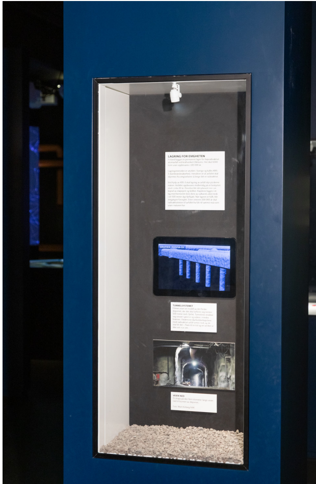
Eksempel på lang tids lagring av atomavfall, ved kraftverket Olkiluoto i Finland.